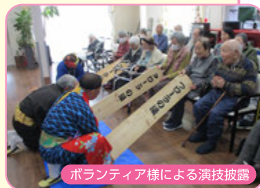
ボランティア様による演技披露