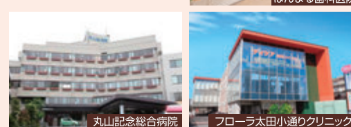
ほんまる歯科医院

さらに、医療法人慈正会「丸山記念病院」医療法人社団幸正会「岩槻南病院」の連携医療機関を持ち、随時診療・手術・入院が可能です。