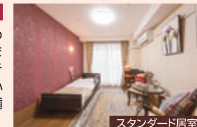
スタンダード居室

入居者様のご希望に合わせて家具等の配置ができます。また居室内で電話やテレビ、パソコンも使え、心豊かなスロースタイルの設備も整っています。